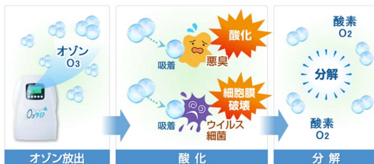
オゾン脱臭・除菌・ウイルス不活化のしくみ

近年、医療施設やホテルなどの宿泊施設でオゾン発生装置が導入され、効果を発揮しています。 薬剤は一切不使用でお布団を消臭・殺菌消毒することができますので、安心安全です。